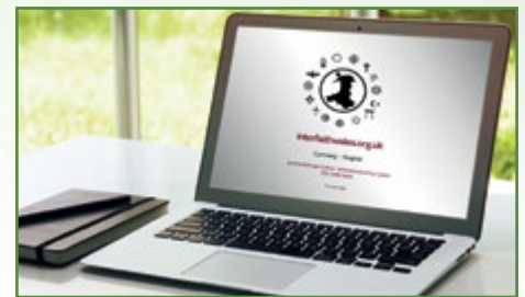
Cytûn sy'n rheoli gwefan Rhyng-Ffydd Cymru, nodwch yr enw parth newydd: www.interfaith-wales.org.uk

Mae Cytûn yn parhau i ddarparu cymorth gweinyddol i Gyngor Rhyng-Ffydd Cymru. Mae gwaith y Cyngor yn berthynol o ran natur yn adeiladu ar ysbryd o barch, cyfeillgarwch a chydweithrediad. Cynhaliwyd cyfarfodydd yn addoldai ein gilydd - yn enwedig yn ystod yr Wythnos Rhyng-Ffydd ym mis Tachwedd.