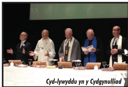
Cyd-lywyddu yn y Cydgynulliad

Mae trafodaethau'n parhau ynghylch sut y gall eglwysi dystiolaethu a gweinidogaethu o amgylch y ddarpariaeth bosib o Ganolfan Gristnogol i Gefn Gwlad ar faes y Gymdeithas Amaethyddol Frenhinol yn Llanfair-ym-Muallt. Mae Cytûn yn diolch am y bartneriaeth weithio dda sydd wedi'i sefydlu gyda'r Gymdeithas a phartneriaid Cristnogol. Gwerthfawrogir gwaith y caplaniaid gwledig yn fawr.